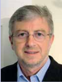
Liebe Leserin, lieber Leser!

Kürzlich fragte mich ein neuer Kunde, was meissnerdruck eigentlich macht.